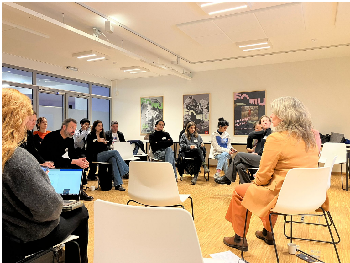
© NICC, open gesprek in FOMU, 2025

Toch is en blijft niet alleen de vraag wie , maar ook van wat er precies geleid moet worden? De verwarring in verband met de nieuwe taken/functionies/rollen die kunst- en erfgoed- instellingen volgens de conceptnota vanaf 2026 (in transitie) zullen moeten vervullen - en de vaagheid die hier voorlopig nog steeds rond heerst - kwam zo aan het eind van het gesprek opnieuw bovendrijven. De conceptnota schrijft een ingrijpende visie uit, maar blijft concrete krijtlijnen of trajecten die deze visie zullen begeleiden nog schuldig. Aan het eind van het gesprek in het FOMU kan de sector dan ook niet langer alleen in eigen boezem blijven kijken: ook het leiderschap van de beleidsmakers zelf zal zich in de toekomst moeten aanpassen om gedeeld leiderschap, binnen de cultuursector en daarbuiten, mee mogelijk te maken.