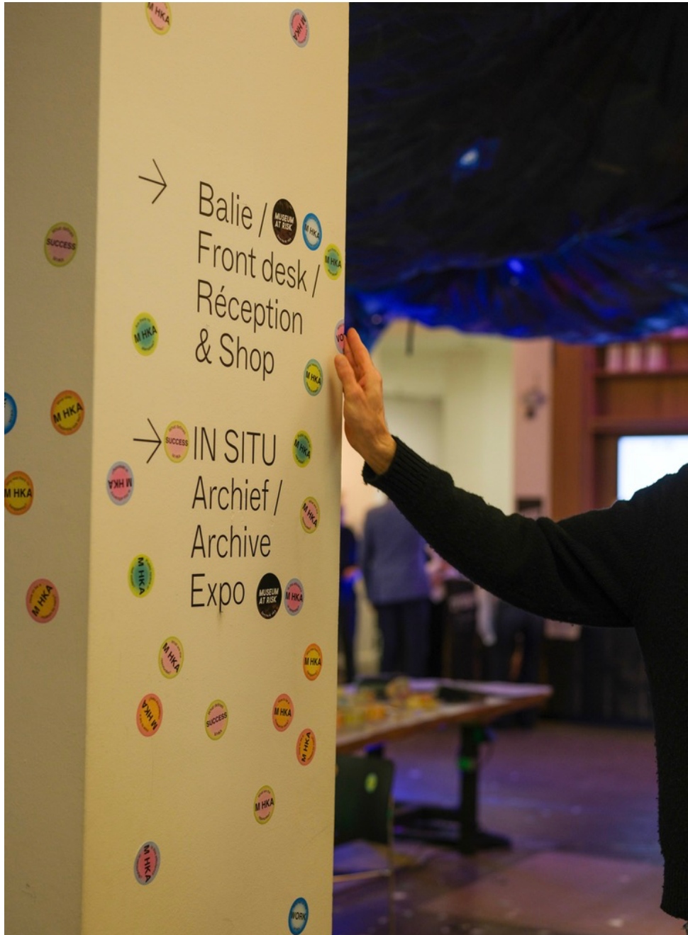
24-hour Museum At Risk, M HKA, 2025

gebracht, is het dat de beeldende kunstensector in de toekomst meer in dialoog zal moeten treden met elkaar; net zoals beleidsmakers de tijd zullen moeten vrijmaken om naar hen te luisteren. Alleen op die manier zal een 'gedeelde missie' voor verbetering mogelijk zijn.