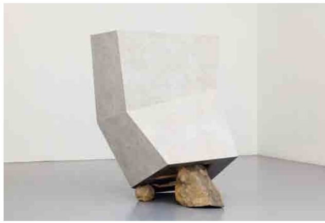
Koenraad Dedobbeleer, 'Disruption of The Anticipated Future', 2009. Copyright Sven Laurent. Courtesy of the artist and Galerie Micheline Swajczer, Antwerp

over. Het onderscheid tussen wat echt en vals of een uniek object en een massaproduct is, lost op. Dat geeft stof tot nadenken. Alle bestaande parameters om de gepresenteerde objecten te benaderen, zijn plots waardeloos.